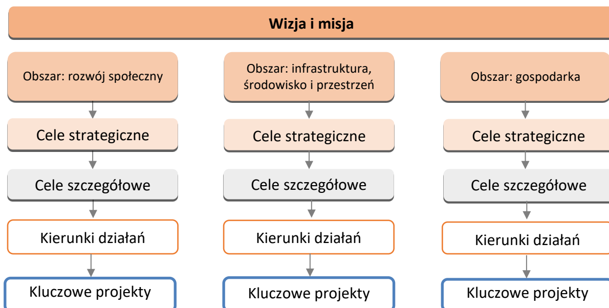
Rysunek 2. Drzewo celów i kierunków działań Strategii

Cele i kierunki działań Strategii są prezentowane w formie drzewa, odrębnie w trzech obszarach: gospodarczym, społecznym i infrastrukturalnym (obejmującym również środowisko i kwestie przestrzenne).