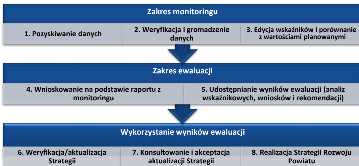
Rysunek 4. Proces monitorowania i ewaluacji Strategii

Proces monitorowania i ewaluacji Strategii prezentuje poniższy rysunek.