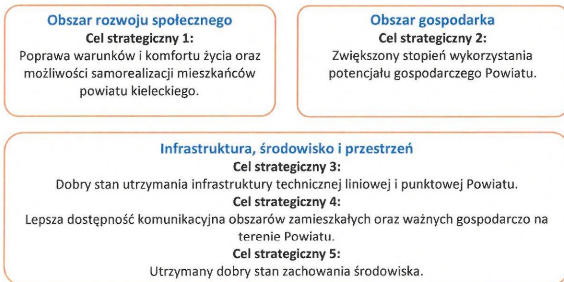
Rysunek 3. Cele strategiczne Powiatu

Cele i kierunki działań Strategii Rozwoju Powiatu Kieleckiego na lata do roku 2030 zostały wypracowane w ramach spotkań warsztatowych z udziałem głównych interesariuszy Powiatu. Cele i zadania są prezentowane w formie drzewa, odrębnie w trzech obszarach: gospodarczym, społecznym i infrastrukturalnym (obejmującym również środowisko i kwestie przestrzenne).