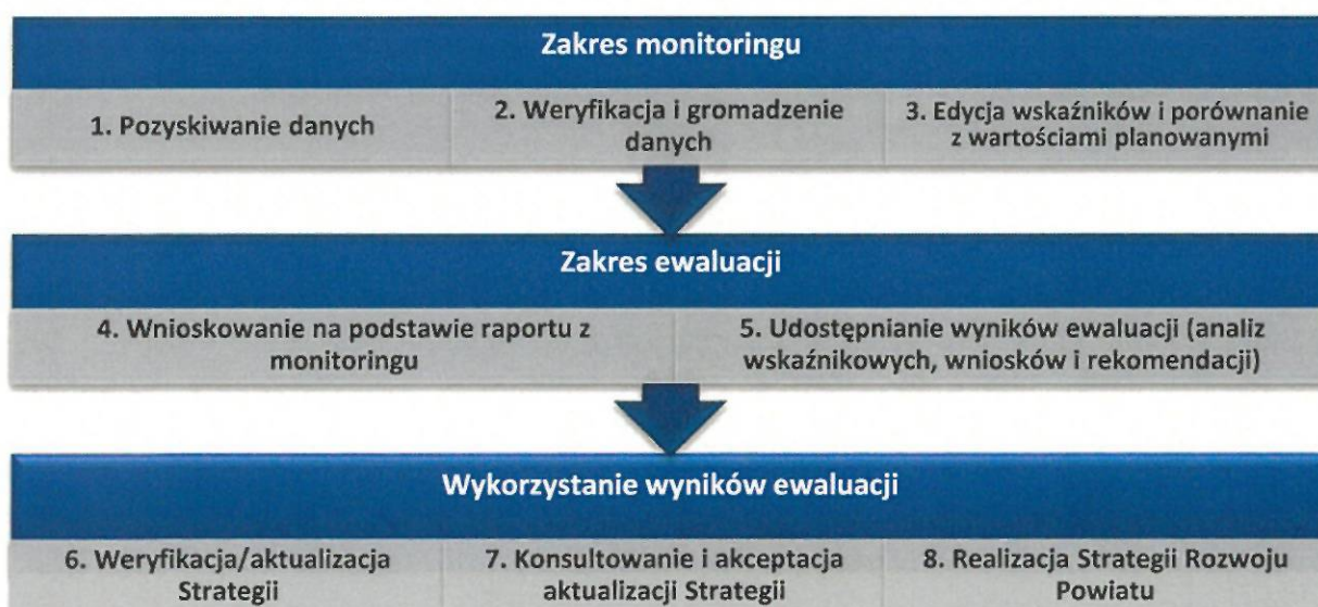
Rysunek 4. Proces monitorowania i ewaluacji Strategii

Proces monitorowania i ewaluacji Strategii prezentuje poniższy rysunek.