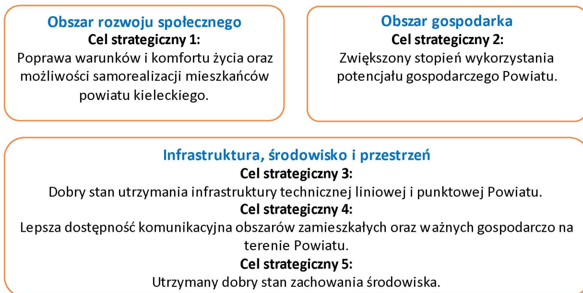
Rysunek 3. Cele strategiczne Powiatu

Cele i kierunki działań Strategii Rozwoju Powiatu Kieleckiego na lata do roku 2030 zostały wypracowane w ramach spotkań warsztatowych z udziałem głównych interesariuszy Powiatu. Cele i zadania są prezentowane w formie drzewa, odrębnie w trzech obszarach: gospodarczym, społecznym i infrastrukturalnym (obejmującym również środowisko i kwestie przestrzenne).