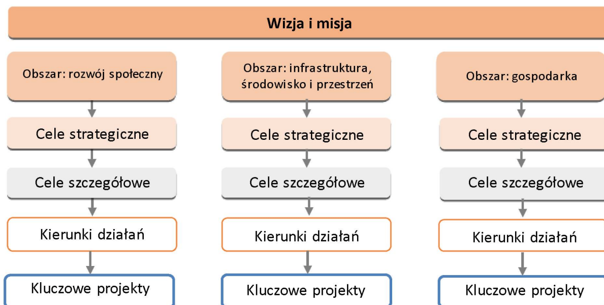
Rysunek 2. Drzewo celów i kierunków działań Strategii

Cele i kierunki działań Strategii są prezentowane w formie drzewa, odrębnie w trzech obszarach: gospodarczym, społecznym i infrastrukturalnym (obejmującym również środowisko i kwestie przestrzenne).