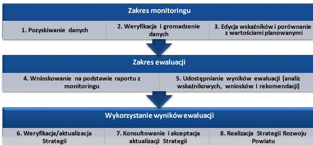
Rysunek 4. Proces monitorowania i ewaluacji Strategii

Proces monitorowania i ewaluacji Strategii prezentuje poniższy rysunek.